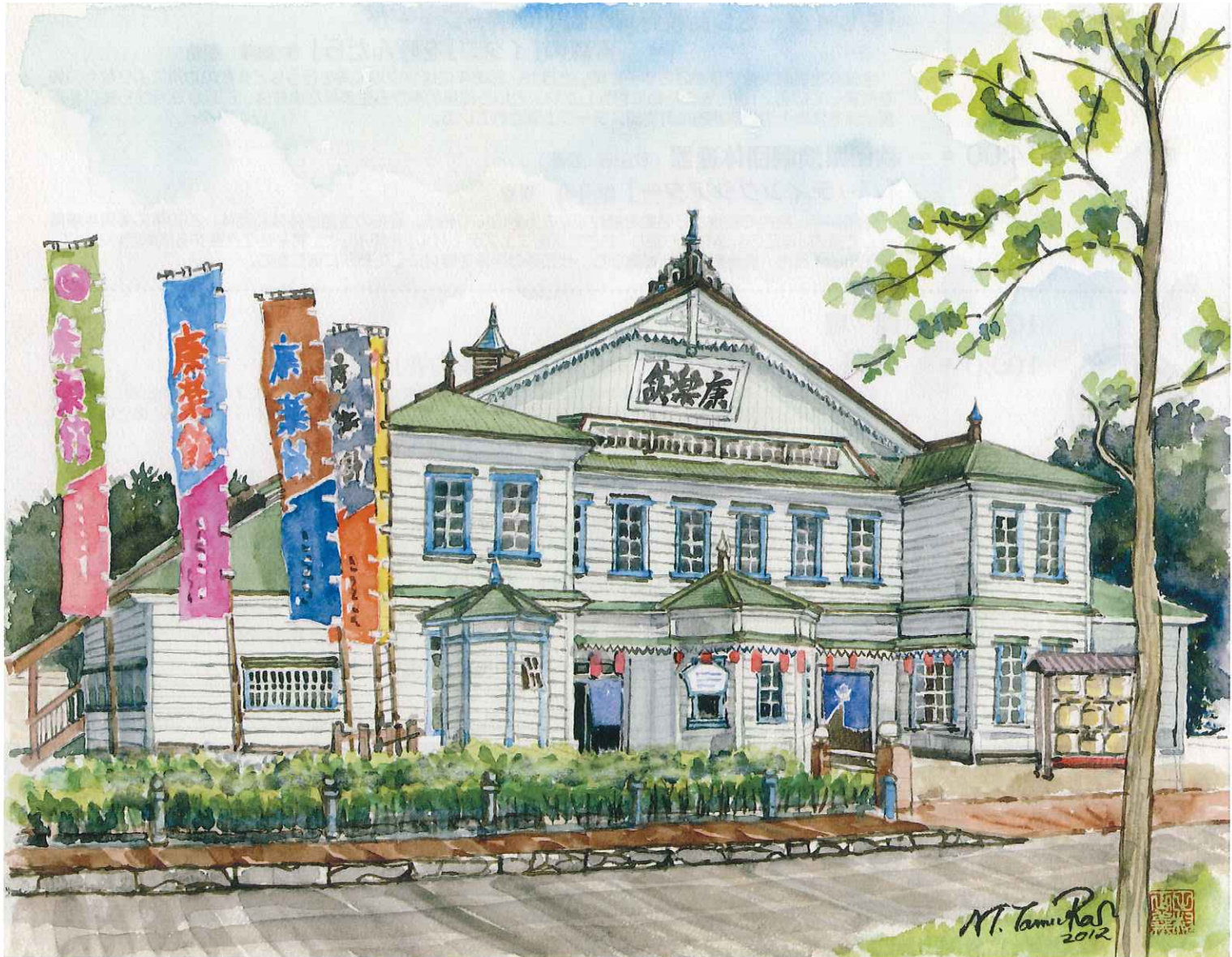
田村まさよし画：「康楽館」(明治43年竣工 国重要文化財) ※許可無く複製を禁じます。